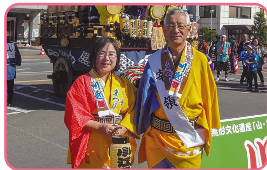
川合善明市長と川越まつりにて