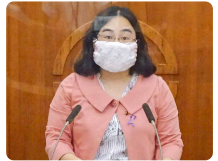
川越市議会にて一般質問の様子

次期計画の約8割の事業が順調で待機児童は減少したものの、各種審議会等における女性の登用率は3割弱であらゆる分野に女性が参画できる環境づくりはまだ不十分です。コロナ禍で改めて浮き彫りになった課題を次期男女共同参画基本計画に反映させて欲しいと一般質問しました。皆様との約束を守り川越が住みつづけたいまちとなるよう全力でがんばります。