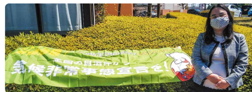
「小江戸かわごえ脱炭素宣言」を表明!