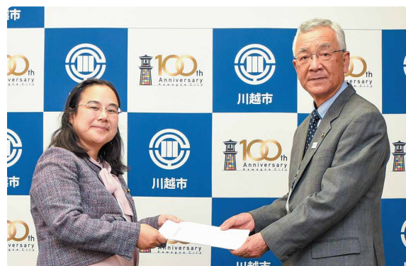
川合善明市長に市政要望を提出しました。いとう正子(左)、川合市長(右)

議会は市役所でどなたでも傍聴できます。インターネットでライブ中継・録画中継しています。