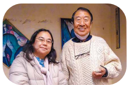
映画「食の安全を守る人々」 プロデューサー山田正彦さん (元農林水産大臣)と

きます。調査をもとに、440棟・ 約2万戸のマンションの管理適 正化計画を策定する予定です。 市内での転入は増えておらず、 魅力あるまちづくりが重要です。