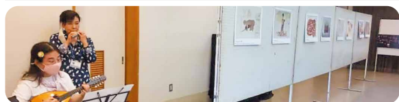
原爆絵画展にて マンドリン演奏中