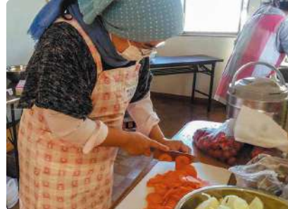
子ども食堂での食事づくりの様子