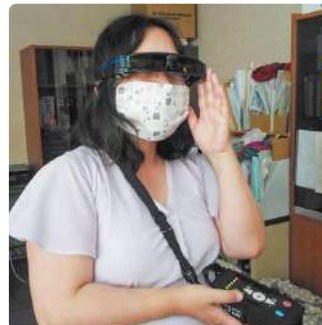
暗所視支援眼鏡 (より明るい視界を提供)を体験