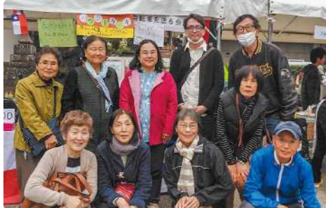
自転車を送る会ほかさまざまな国際交流イベントに参加

キューバに自転車を送る会は、1994年にガソリン不足が深刻だったキューバに自転車を送って励まそうと発足、毎年国際交流フェスタに参加しています。