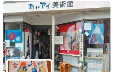
あいアイ美術館 (NPO法人あいアイ)