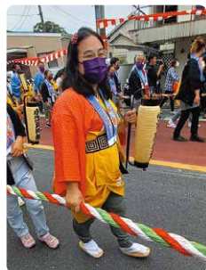
3年ぶりに開催された 川越まつりにて