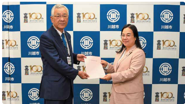
川合善明市長に 市政要望を提出しました