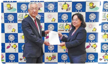
川合善明市長に市政要望を提出しました