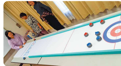
カーレット体験中