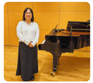
小江戸川越第九の会にて合唱