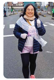
小江戸川越ハーフマラソン

小江戸川越ハーフマラソンに参加しました。ファンラン(4km)を完走しました。また、 小江戸川越第九の会 にも合唱で参加。